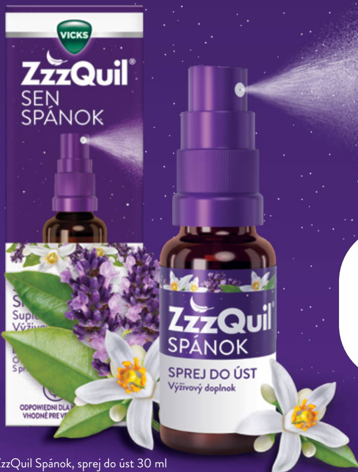
ZzzQuil Spánok, sprej do úst 30 ml

Nezabudnite si pribaliť na cesty. Pomôže Vám rýchlo zaspáť.*